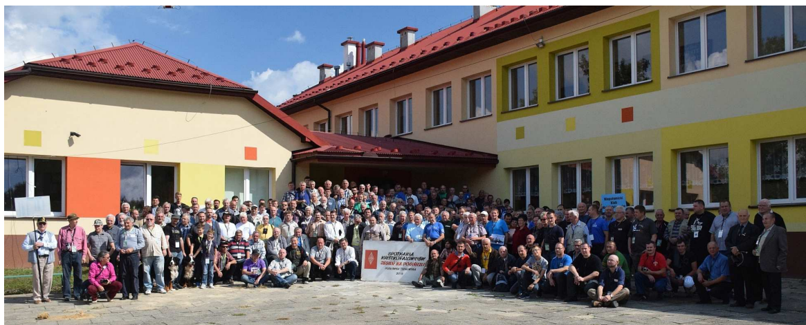
Uczestnicy spotkania „Krótkofalarska Jesień na Pogórze” - Jodłówka Tuchowska 2015 r.

Zarząd Oddziału Terenowego PZK nr 28 w Tarnowie, serdecznie zaprasza na XXXI już spotkanie w Jodłówce Tuchowskiej, pod hasłem „Krótkofalarska Jesień na Pogórze” , które organizowane jest dla podsumowania Zawodów Tarnowskich i wręczenia zwycięzcom trofeów. Spotkanie tradycyjnie odbywa się w drugi weekend września. W bieżącym roku będą to dni 9-11 września .