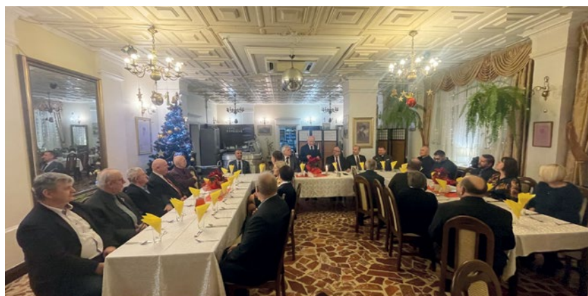
UCZESTNICY SPOTKANIA W JAROSŁAWIU

W związku z tegoroczną aktywnością Wielkiej Orkiestry Świątecznej Pomocy kilka klubów krótkofalarskich w kraju podjęło akcję promowania tej inicjatywy zbierając przy okazji datki na zbożny cel. I tak członkowie z klubu przy Uniwersytecie Zielonogórskim SP3PGX zapraszają do akcji dyplomowej trwającej od 1 stycznia do 31 grudnia br., gdzie każdy uczestnik konkursu po przeprowadzeniu 1 QSO będzie miał możliwość uzyskania certyfikatu w wersji elektronicznej. W tym czasie stacja SP3PGX pracować będzie pod znakiem SP32WOSP.