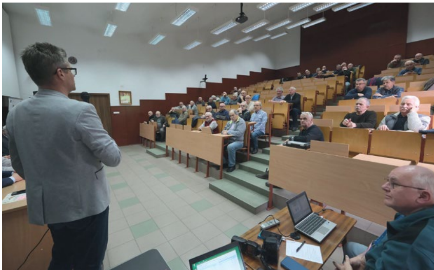
UCZESTNICY ZEBRANIA W SZCZECINIE

12 stycznia br. o godz. 17.00 w restauracji „Klasyczna” w Jarosławiu odbyła się noworoczne spotkanie opłatkowe, w którym wzięli