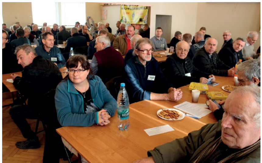
UCZESTNICY ZEBRANIA W PSZOWIE