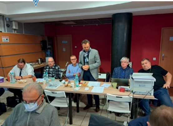
PREZYDIUM ZEBRANIA. WIĘCEJ ZDJĘĆ Z ZEBRANIA ZNAJDUJĄ SIĘ NA STRONIE: https://ot09.pzk.org.pl/multimedia/index.php?sfpg=WkpBW-kRZICyG1tBPVetBTKlBL1dhhG5llFpIYnJhbmllIFNwcmF3b3pkYXdjemUgUE9UIFBaSyAyMDIzLyozZTRmYWVjMWExZDkwODQzYzgzOYzFjMmVzZWQ4YzI4OWE00EzNmZiMmZiMzUxNmlyNjJlZDMxN2E3Y2JzJWE00Q&info=0