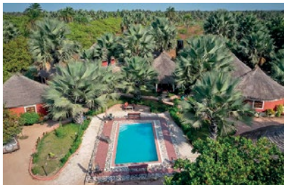
KRÓLESTWO SP3PS-C5SP W GAMBII