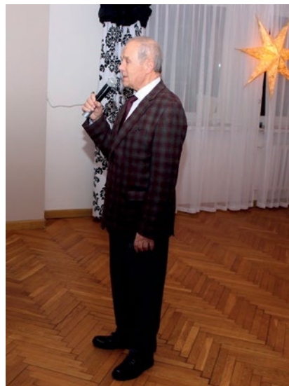
WOJCIECH SP9PT OTWIERA ZEBRANIE

W dalszej kolejności prezes PZK Tadeusz SP9HQJ omówił aktualną sytuację w PZK, dotychczasowe działania Prezydium ZG PZK i plany zamierzeń PZK na najbliższe miesiące. Zwrócił uwagę na fakt, iż w maju przyszłego roku odbędzie się Krajowy Zjazd Delegatów PZK, na którym dokonane zostaną zmiany w statucie PZK i wybrane zostaną nowe władze tj. w Prezydium ZG PZK i w Głównej Komisji Rewizyjnej PZK.