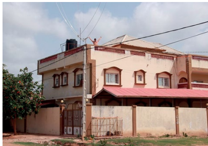
STACJA BAZOWA NA HOSTELU

Mój projekt Gambia C5SP dalej rozwijam na terenie naszej wioski. Pierwsze anteny już stoją, a nowe są w drodze. Radiostacja też już na miejscu. Nasza wioska jest oddalona od miejskich zakłóceń, więc komfort odbioru jest bezcenny, a warunki dobrej propagacji są przez cały rok.