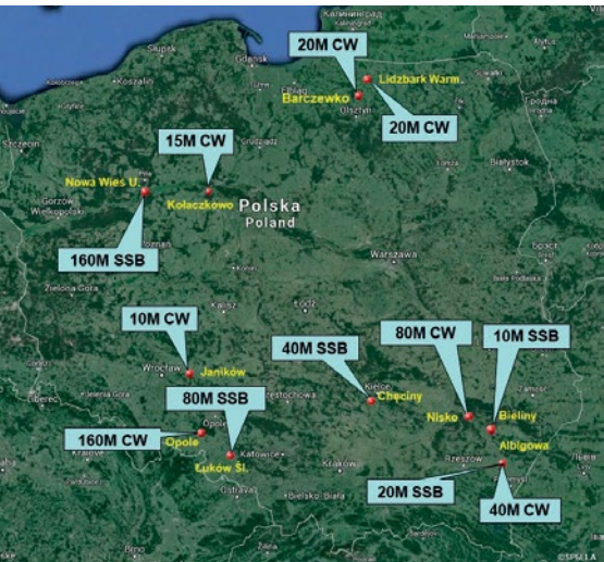
ROZMIESZCZENIE STACJI SN0HQ W KRAJU