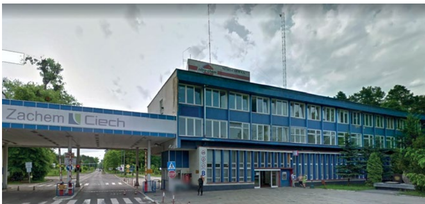
NOWA SIEDZIBA SEKRETARIATU PZK – BYDGOSZCZ, UL. WOJSKA POLSKIEGO 65 A.

sporu pomiędzy OT 73 a OT 31 PZK i tę kwestię należy niezwłocznie rozstrzygnąć. Nie omieszkał dodać, iż od czasu do czasu do Prezydium docierają sygnały o naganach zachowaniach niektórych i często anonimowych nadawców na pasmach radiowych i należy z tym walczyć. Co prawda właściwym organem do podjęcia działań jest UKE, ale Prezydium chce mieć informację w tym zakresie, aby w porozumieniu z UKE im przeciwdziałać.