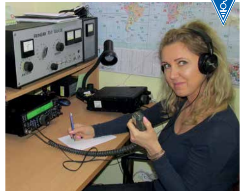
WIOLETTA SP8VO W ZAWODACH PRZEPROWADZIŁA 51 QSOS. BRAWO!