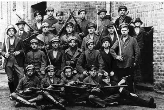
UCZESTNICY III POWSTANIA ŚLĄSKIEGO

Z inicjatywy Śląskiego Oddziału Terenowego PZK w Katowicach, przy współudziale Rybnickiego Oddziału Terenowego PZK w Pszowie, Klubu Ligi Obrony Kraju SP9KDU w Tarnowskich Górach oraz SP9KJM w Siemianowicach Śl. organizowana jest od 1 maja (godz. 00.00 UTC) do 31 maja 2021 r. (godz. 23.59 UTC) krótkofalarska akcja dyplomowa pod nazwą „III Powstanie Śląskie”. Stacje okolicznościowe biorące udział w akcji dyplomowej to: 3Z1921PS – SP6KEP,