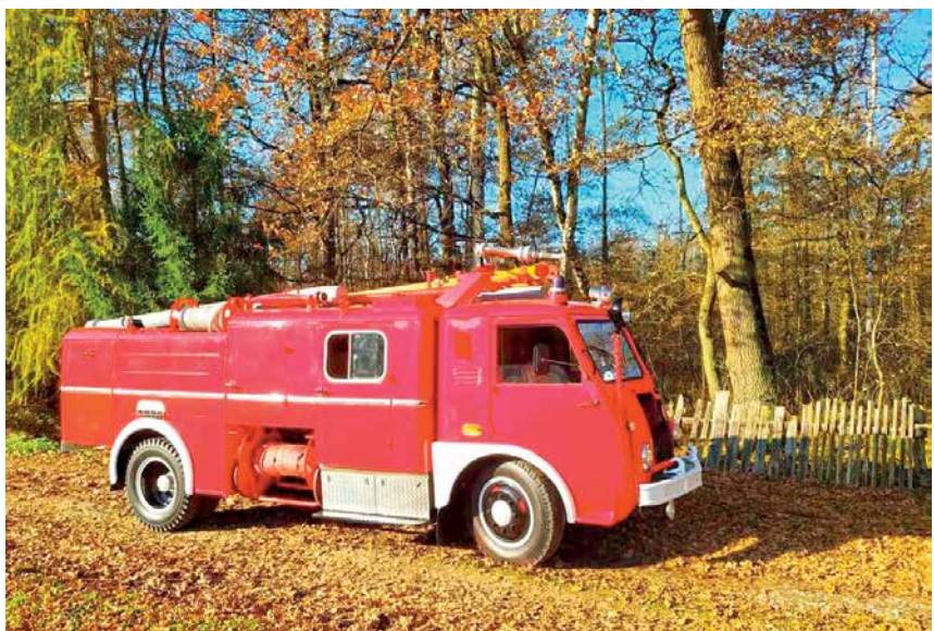
ZABYTKOWY SAMOCHÓD GAŚNICZY OSP W NIEPOŁOMICACH

Na stronie: http://www.southgatearc.org/news/2020/december/elettra-the-miracle-ship-award.htm#.X_toTkHPyUk Cristiano IW4CLV informuje o ciekawej akcji dyplomowej trwającej od 1 stycznia do 31 grudnia 2021 roku. Przedsięwzięcie to ma