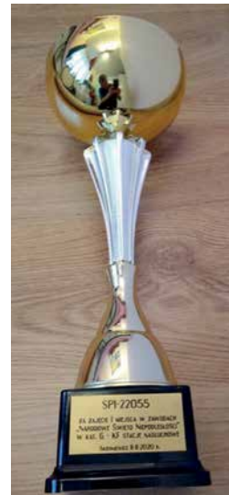
I MIEJSCE W KRAJU DLA SP1-22055 W ZAWODACH „NARODOWE ŚWIĘTO NIEPODLEGŁOŚCI 2020”