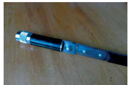
POSZUKIWANA ANTENA TAŚMOWA