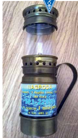
I MIEJSCE W KRAJU DLA SP1-22055 W ZAWODACH „O REPLIKĘ LAMPY IGNACEGO ŁUKASIEWICZA 2020”