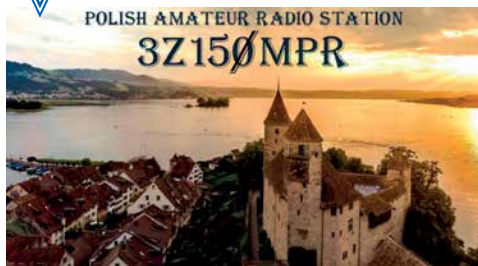
OKOLICZNOŚCIOWY DYPLOM KLUBU SP9KDU WYDANY W ZWIĄZKU Z 150-LECIEM MUZEUM POLSKIEGO W RAPPERSWILU. INFORMACJA W SPRAWIE AKCJI DYPLOMOWEJ UKAZAŁA SIĘ W GRUDNIOWYM WYDANIU KP