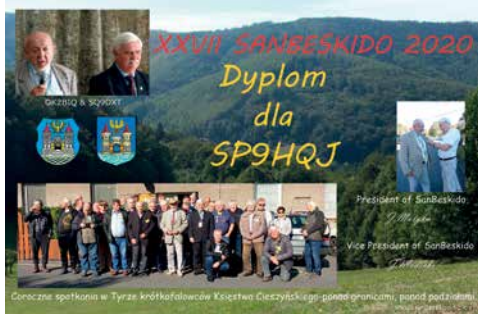
ODBYWAJĄCE SIĘ CO ROK W PAŹDZIERNIKU SAN BESKIDO, ORGANIZOWANE PRZEZ JANKA OKZBIQ I JANKA SQ9DXT, Z UWAGI NA WIRUS COVID 19 W 2020 ROKU NIE ODBYŁO SIĘ, ALE ODBYŁO SIĘ W TRYBIE ZDALNYM TZN. NA PASMACH RADIOWYCH I KAŻDY UCZESTNIK SPOTKANIE RADIOWEGO MIAŁ OKAZJĘ OTRZYMAĆ OKOLICZNOŚCIOWY DYPLOM

Podobny system łączności działa też w Centrum Kliniczno-Dydaktycznym w Łodzi.