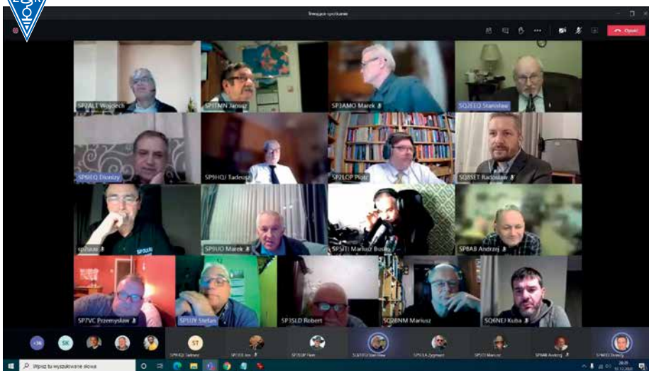
TAK WYGLĄDAŁY OBRADY XXVI KZD PZK