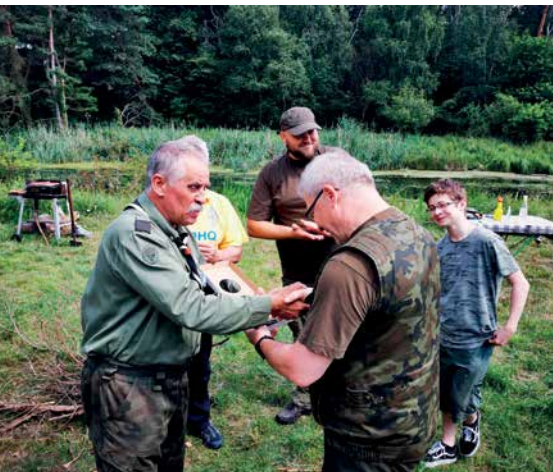
PRZEKAZANIE GRAWERTONU DLA NADLEŚNICTWA BYDGOSZCZ