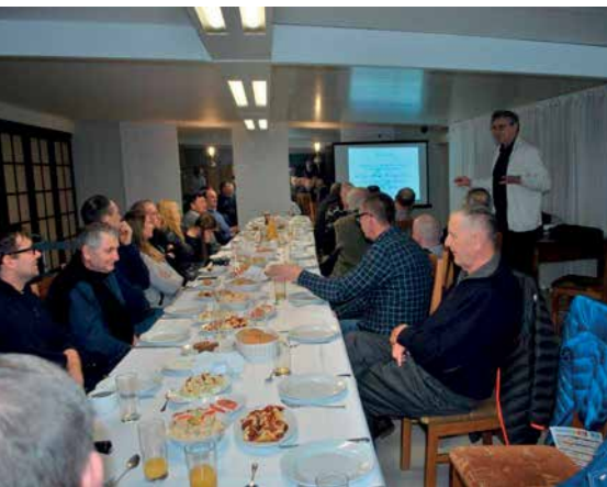
INFORMACJA GRZEGORZA SP3CSD NA TEMAT HISTORII I ROLI OGÓLNO-POLSKIEGO KLUBU SP OTC