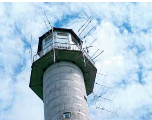
ANTENY NA WIEŻY WIDOKOWEJ W WOLEJ GÓRZE