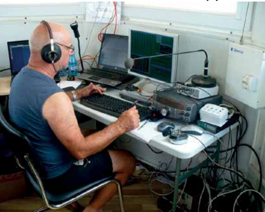
WZOROWO PRZYGOTOWANE STANOWISKO OPERATORA SN11

W tym roku nasze spotkanie zbiegło się ze 120. rocznicą otwarcia wieży widokowej na szczycie Kopy Biskupiej. Z tej okazji obecni władarze wieży urządzili festyn,