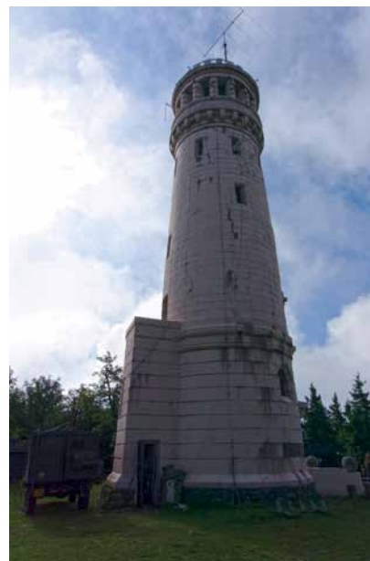
ANTENA NA 10 M (4-EL. NA 26 M) NA SZCZYCIE WIEŻY NA WIELKIEJ SOWIE

Zgodnie z zapowiedzią lokalizacja stacji