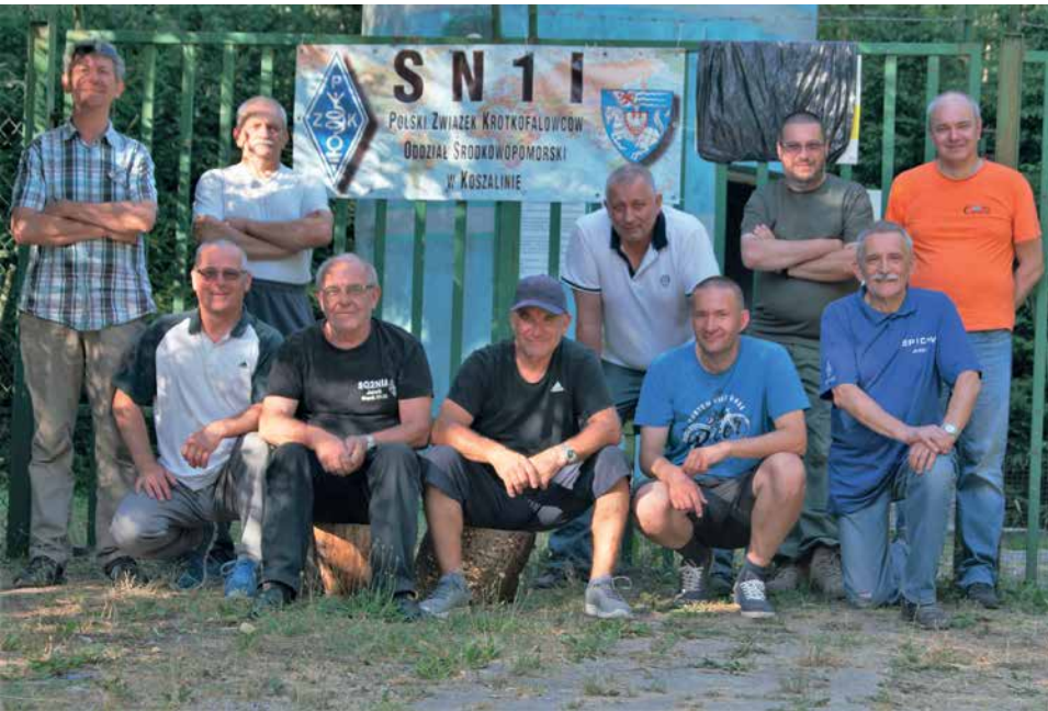
UCZESTNICY III PRÓB SUBREGIONALNYCH