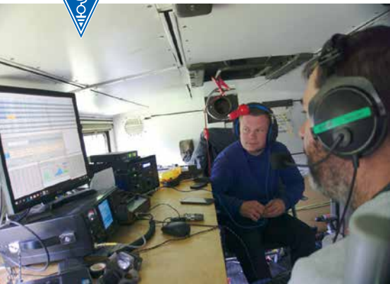
RADIO SHACK NA WIELKIEJ SOWIE