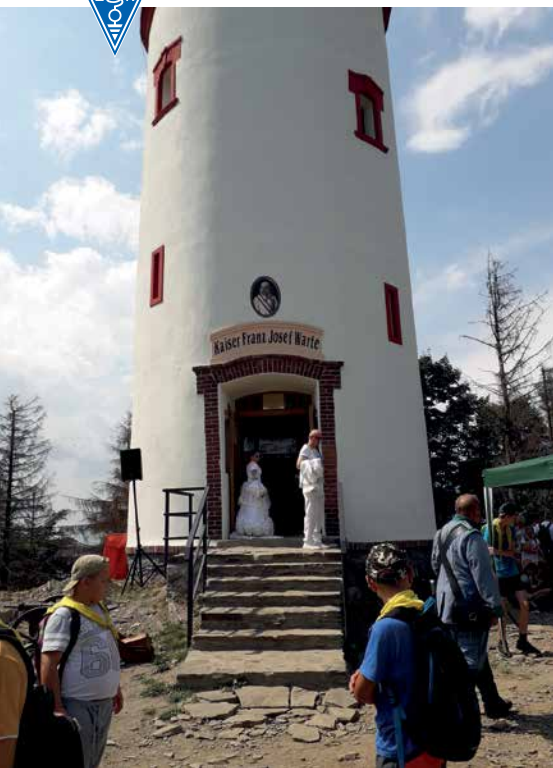
ODNOWIONA WIEŻA WIDOKOWA NA KOPIE BISKUPIEJ

którego uczestnicy ubrani byli w stroje odpowiednie do II połowy XIX wieku. Widowisko było wspaniałe: był cesarz Franz Josef, żołnierze w strojach z epoki, salwa dla upamiętnienia rocznicy oraz koncert muzyki austriackiej i czeskiej.