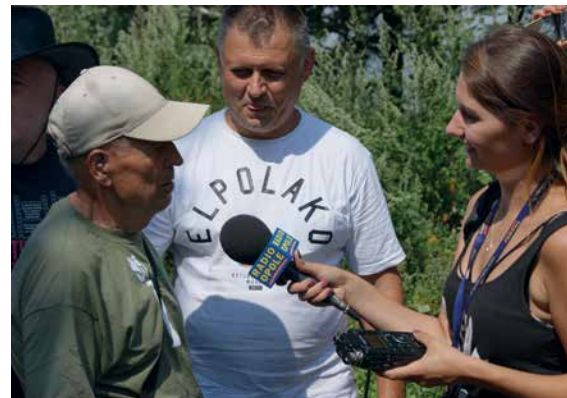
WACEK SQ6SEA UDZIELA WYWIADU REDAKTOR WIKTORII PALARCZYK Z RADIA OPOLE