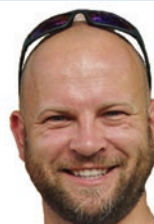
Wy 73! Remi SQ7AN

W tym numerze będzie o Łosiu i o innych ciekawostkach z krótkofalarskiego świata, które jak co miesiąc zbieramy i opisujemy dla Was, drodzy Czytelnicy. Miłych, ciepłych i pogodnych wakacji.