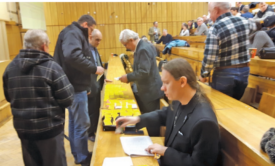
SALA OBRAD PODCZAS WALNEGO ZEBRANIA OT 04