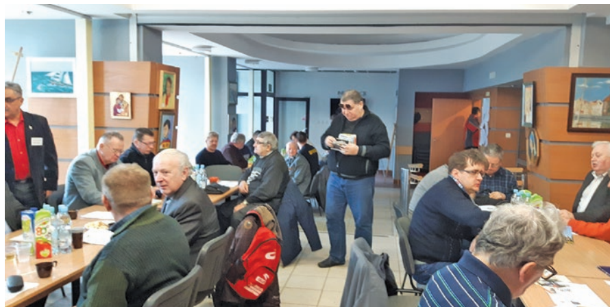
W CZASIE OBRAD WALNEGO ZEBRANIA POMORSKIEGO OT PZK