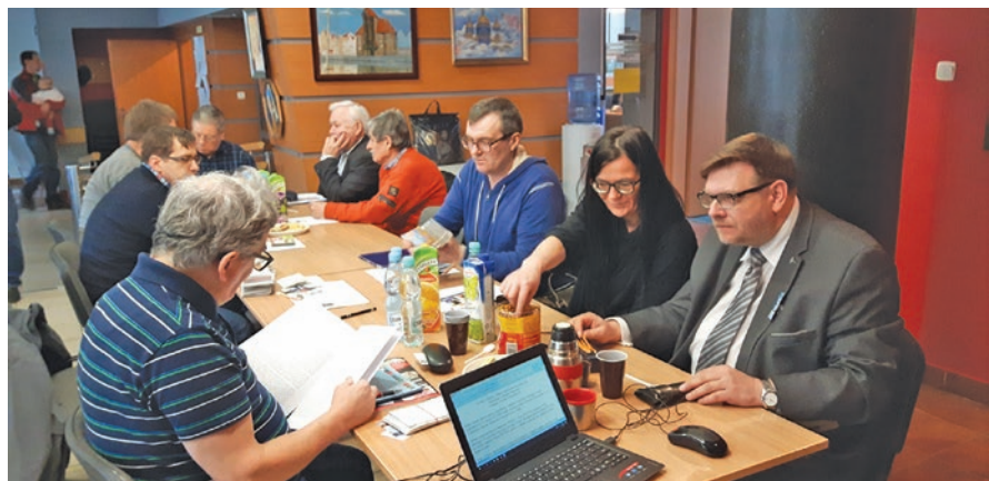
W CZASIE OBRAD WALNEGO ZEBRANIA POMORSKIEGO OT PZK