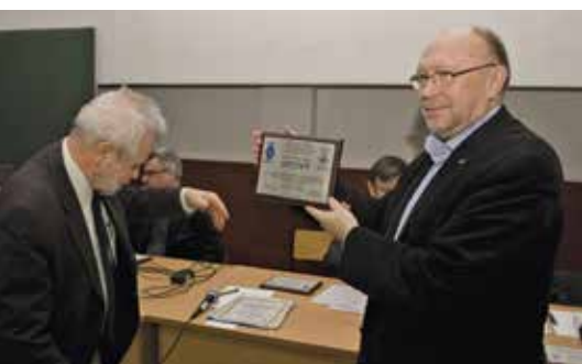
GRAWERTON DLA MARKA SP1JNY EMC MANAGERA PZK