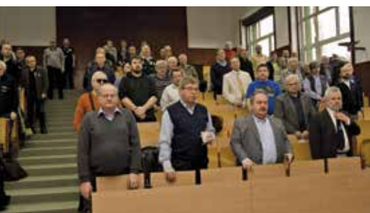
ZEBRANI UCZCILI CHWILĄ CISZY PAMIĘĆ KOLEGÓW KTÓRZY ODESZLI NA ZAWSZE Z NASZYCH SZEREGÓW