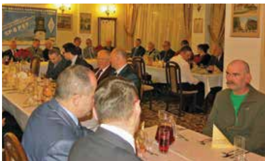
UCZESTNICY SPOTKANIA OPLATKOWEGO JAROSŁAWSKICH KRÓTKOFALOWCÓW.