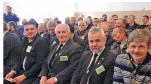
SALA OBRAD WALNEGO LKK