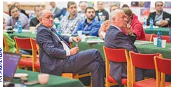
W TRAKCIE V KONFERENCJI ARISS