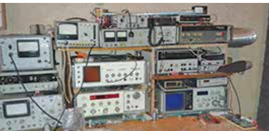
SPRZĘT POMIAROWY LKK NIE JEST NAJNOWSZEJ GENERACJI, ALE SPRAWNY