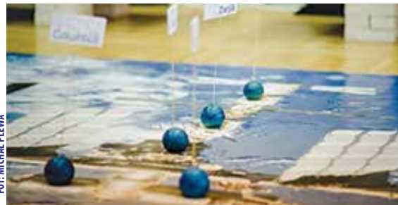
W TRAKCIE V KONFERENCJI ARISS