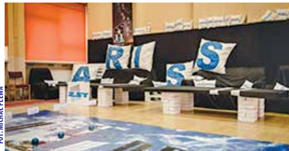
W TRAKCIE V KONFERENCJI ARISS