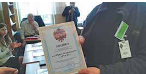
DYPLOM DLA JURKA SP5VJO