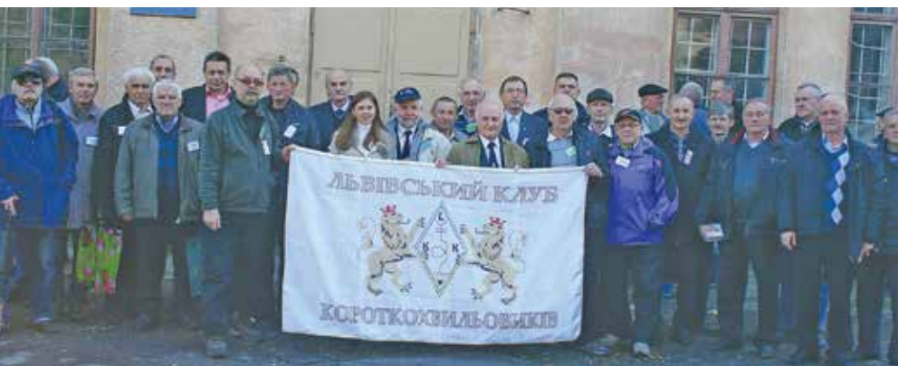
UCZESTNICY WALNEGO ZEBRANIA LKK