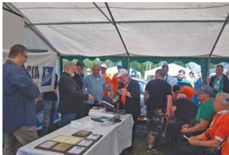
PREZES PZK WRĘCZA NAGRODY W KONKURSIE „RADIOREAKTYWACJI”

Nie była głosowana uchwała dotycząca reasumpcji głosowania nad uchwałą nr 441/1/2008 o podziale środków z tyt. OPP. Prezydium wykazało jeszcze przed posiedzeniem, że w chwili głosowania 22 listopada 2008 roku na kontach PZK nie było kwoty, którą ówczesny ZG przeznaczył dla OT. Od tego okresu ze środków centralnych są przeznaczane środki przypisane poszczególnym OT za 2007 r. Celem tej uchwały było zmobilizowanie członków OT do lobbingu na rzecz przekazywania środków z tyt. 1% od podatku na rzecz OT PZK oraz pobudzenie aktywności w podejmowaniu najróżniejszych działań na rzecz rozwoju PZK i krótkofalarstwa w ogóle. Tak się też stało. Dowodem może być chociażby przyrost liczby członków PZK w latach 2008–2010 o ok. 800, a także znaczące kwoty przeznaczane przez darczyńców na rzecz poszczególnych OT, w tym klubów. Od tego okresu zanotowano trwający do dzisiaj wzrost zakupów urządzeń oraz liczby spotkań środowiskowych, dni aktywności, zawodów krótkofalarskich etc.