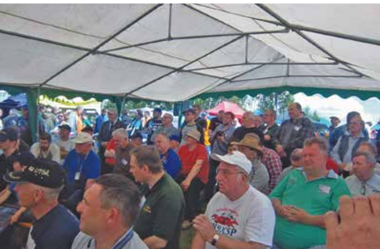
WYPEŁNIONO PO BRZEGI NAMIOT PRELEKCYJNY