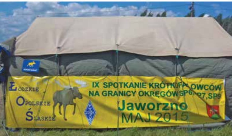
BANNER ZAPRASZAJĄCY NA ŁOSIA