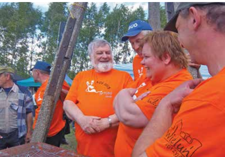
OD LEWEJ: SP7CBG, SP9UO, S09AAH, SQ95BF PO ODŚLONIĘCIU ZEGARA SŁONECZNEGO NA ŁOSIU