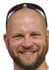
Vy 73! Remi SQ7AN

Trzy główne teksty w tym miesiącu zachęcają nas do działania. Fotorelacje z kolei do oglądania i planowania przyszłorocznych zlotów i spotkań, na które chcemy pojechać.