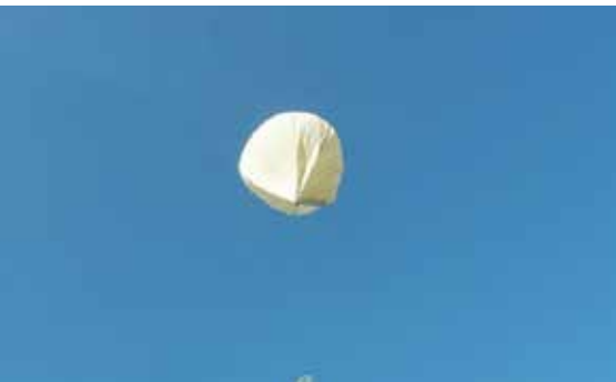
SEBA-6 WYRUSZA NA WSCHÓD