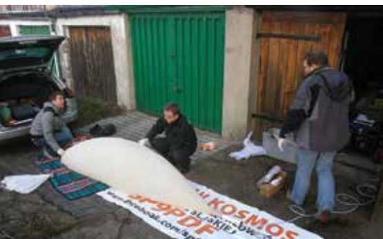
PRZYGOTOWANIA PRZED STARTEM BALONU SEBA-6