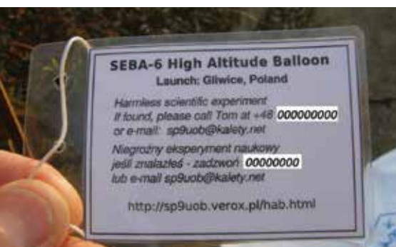
TABLICZKA INFORMACYJNA BALONU SEBA-6

często z prędkością przekraczającą 300 km/h, dzięki prądowi strumieniowemu.