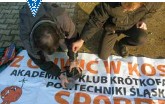
BALON SEBA 6. TO JUŻ ZZA CHWILE START