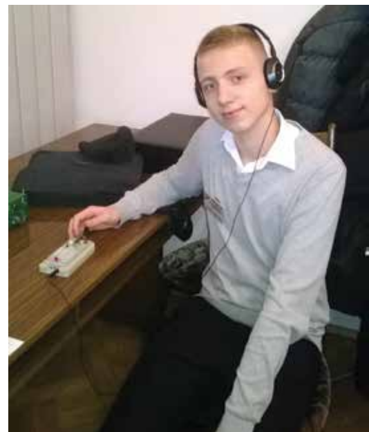
SEWERYN Z KLUCZEM – NAGRODĄ

Nagrodą stał się specjalny klucz produkowany na Białorusi przystosowany do treningu w szybkiej telegrafii. Wręczenia nagrody dokonał Zbyszek SP2JNK, zastępca prezesa PZK ds. sportu, podczas ostatniego Walnego Zebrania Sprawozdawczego Środkowo-Pomorskiego Oddziału Terenowego PZK (OT22).