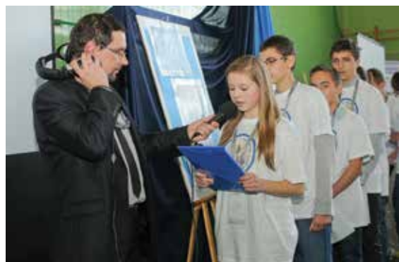
GABI ROZMAWIA Z KOSMONAUTĄ.