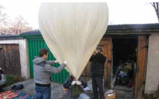
PRZYGOTOWANIA PRZED STARTEM BALONU SEBA-6