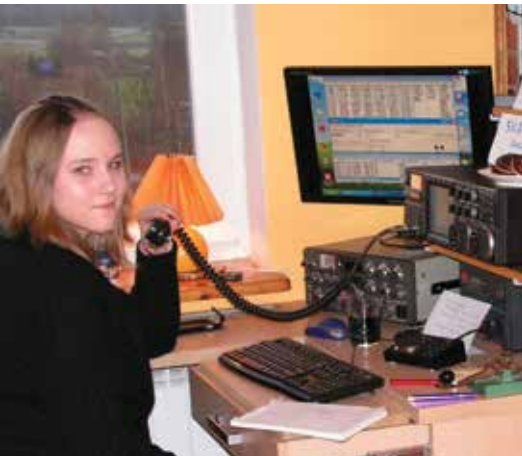
MAGDA SQ3TGZ NADAJE POD ZNAKIEM SNOYOTA