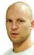
Vy 73! Remi SQ7AN

Po zesłomiesięcznej lekturze serwujemy wam kolejną porcję ciekawych sprawozdań z naszego małego światka. Szczególnie polecam tekst z okazji 85-lecia „Krótkofalowca Polskiego”. Od pierwszego do tego numeru sporo się wydarzyło i jeszcze więcej napisało. Zachęcam też do pozostałych tekstów, ponieważ każdy z nich jest wart Twojej – Czytelniku – uwagi.