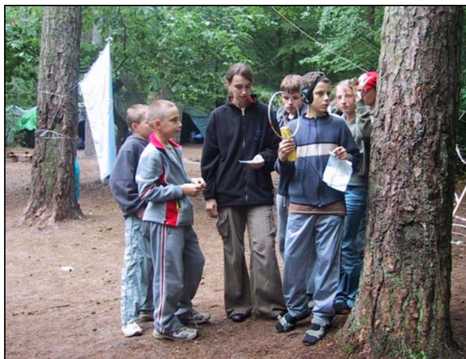
Uczestnicy obozu w sportach obronnych

PZK posiada status Organizacji Pożytku Publicznego. Co roku organizuje obóz szkoleniowy w sportach obronnych dla dzieci i młodzieży, wspiera budowę infrastruktury sieci radiowej która jest szczególnie ważna dla zapewnienia alternatywnej sieci łączności na wypadek sytuacji kryzysowej. Krótkofalarstwo, obok innych sportów i zainteresowań, to sposób na aktywne życie.