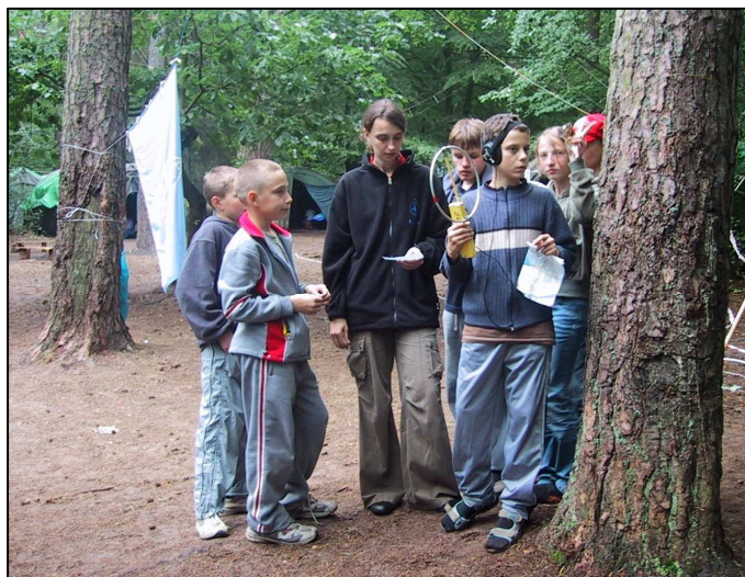
Uczestnicy obozu w sportach obronnych

PZK posiada status Organizacji Pożytku Publicznego. Co roku organizuje obóz szkoleniowy w sportach obronnych dla dzieci i młodzieży, wspiera budowę infrastruktury sieci radiowej która jest szczególnie ważna dla zapewnienia alternatywnej sieci łączności na wypadek sytuacji kryzysowej. Krótkofalarstwo, obok innych sportów i zainteresowań, to sposób na aktywne życie.